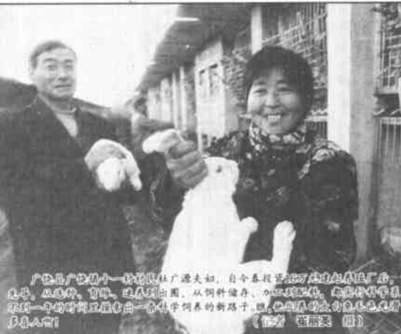
东营区委办公室注重实施形象塑造工程

本报讯 在今年10月13日第十五届世界石油大会召开前夕，我国从境外生产的第一艘6万吨原油油轮往北京燕山石化总公司。这艘原油油轮是胜利油田职工在秘鲁塔拉拉油田奋战三年的结晶，它标志着胜利油田在对外合作上取得了可喜的成果，也标志着我国石油国际化经营已经进入一个新的历史发展阶段。作为我国第二大油田，胜利油田充分发挥自身的人才、技术装备优势，积极参与国内外油田的地面建设、钻井、修井、道路、建筑等施工作业。迄今已同蒙古、土库曼斯坦等国签订境外承包工程合同3个，同美国科委奇公司等签订境内反承包合同4个。今年7月份，他们中标了蒙古国塔姆萨拉油田石油试油项目，这是由美国一家石油公司承包开发的油田，地质条件复杂，地面环境艰苦，施工作业难度很大。胜利油田井下作业公司派出38人的队伍，在极为困难的条件下奋战70天，所试油井全部喷出工业油流，受到外方好评。这一项目的完成，使他们在竞争激烈的国际试油作业市场上占领了一席之地。（魏东 葛明军）